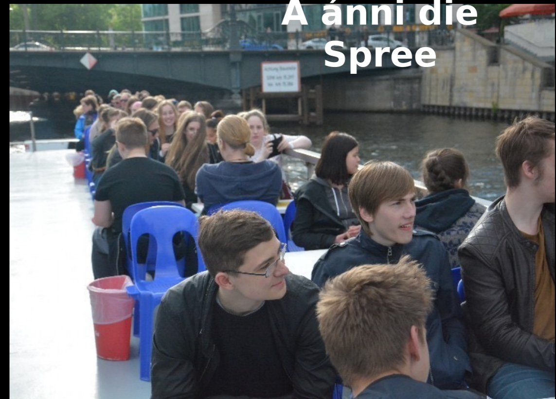
Á ánni die Spree